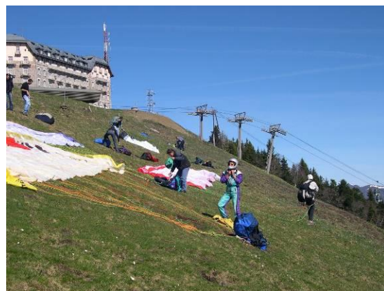
Décollage Luchon Superbagnères

Pour autant, cette dynamique d'expansion et d'affirmation du Vol Libre trouve des limites et doit composer avec les évolutions réglementaires concernant l'espace aérien contrôlé et la protection des sites naturels. Il y a également, et surtout, une forte pression immobilière sur des sites aménagés qui sont une base essentielle pour l'accès à l'activité, la formation et l'entraînement des pilotes avec des implications directes sur le tourisme et l'économie locale.