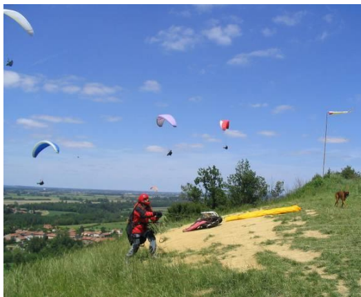
Gensac sur Garonne : un Site de plaine