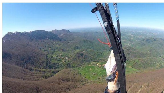
En Vol à Arbas

Le site de Gensac sur Garonne est également très fréquenté en raison de sa proximité de l'agglomération toulousaine. Il se situe à proximité de l'espace aérien contrôlé et toute extension lui serait fatale.